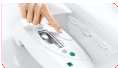
Szalka odłącza się od podstawy za jednym naciśnięciem przycisku.

Wystarczy jeden ruch, a waga dla niemowląt zmienia się w wagę płaską: wciśnięcie przycisku odłącza szalkę od podstawy. Stałe połączenie szalki z podstawą w stanie zablokowanym sprawia, że wagę dla niemowląt można bez problemu podnieść i bezpiecznie przetransportować.