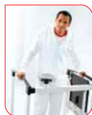
Pacjent w trakcie ważenia może stać lub siedzieć.