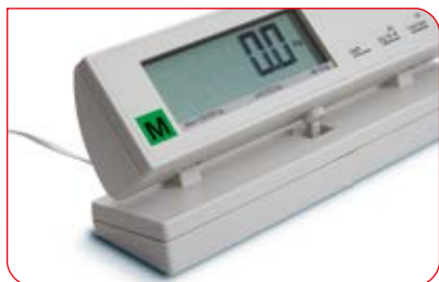
Wyświetlacz można ustawić pod kątem dogodnym do odczytu i korzystać z niego z dala od wyświetlacza.