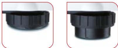
Nóżki poziomujące umieszczone pod platformą wagi zapewniają stabilność na każdym podłożu.

seca 899 wyposażona jest we wszystkie funkcje do częstego użytku: funkcja BMI pomaga w określeniu stanu odżywienia, funkcja HOLD pozwala na zatrzymanie wyniku pomiaru na wyświetlaczu, a funkcja TARA wytarowuje np. masę ciała dzieci trzymanych na rękach dorosłych. Odczyt wyników jest niezwykle wygodny dzięki możliwości dowolnego ustawienia kąta nachylenia panela z wyświetlaczem.