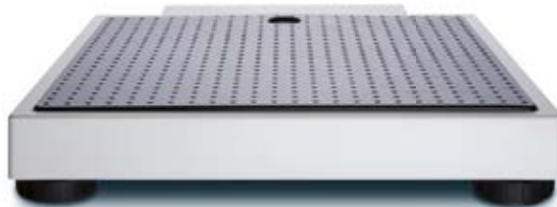
Kompaktowe wymiary i niewielka waga własna umożliwiają wygodny transport i mobilne zastosowanie.