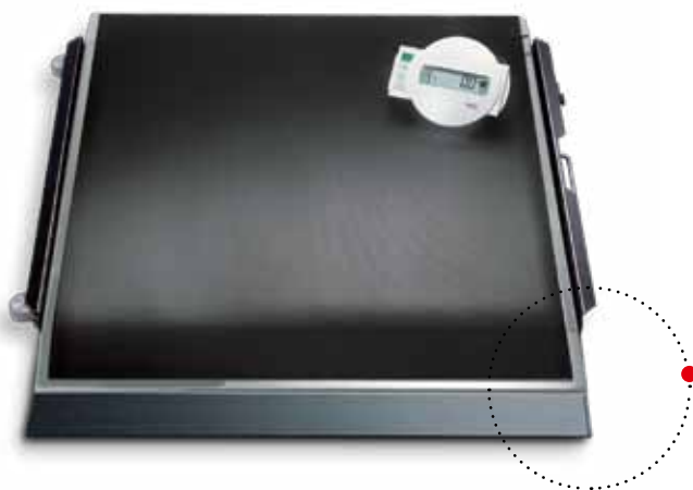
Dostawa obejmuje łatwą do rozkładania rampę podjazdową dla wózków inwalidzkich.