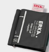
MANKIET ERKA. GREEN CUFF Superb D-RING z dwoma oddzielnymi przewodami (Double tube)