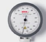
Fabrycznie skalibrowany manometr do Switch 2.0 Comfort 000.30200