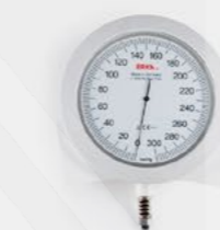
Model bazowy 288.20481