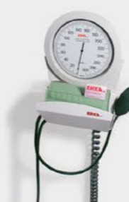
Uchwyt ścienny 295.00003