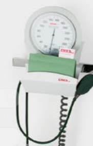
Uchwyt na szynę 295.28700