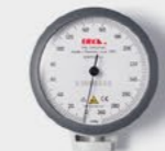
Fabrycznie skalibrowany manometr do Switch 2.0 Smart 000.30200